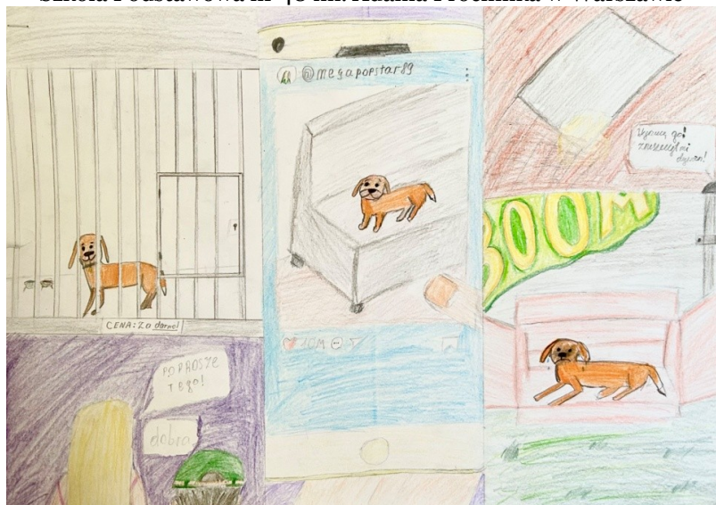
Yaroslav Shrot – Szkoła Podstawowa nr 356 im. Ryszarda Kaczorowskiego w Warszawie