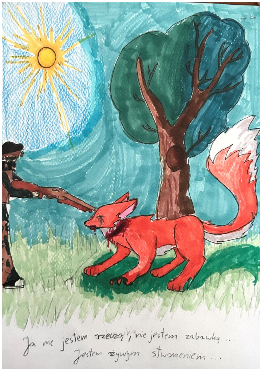
III miejsce Iga Miącz – Szkoła Podstawowa nr 356 im. Ryszarda Kaczorowskiego w Warszawie