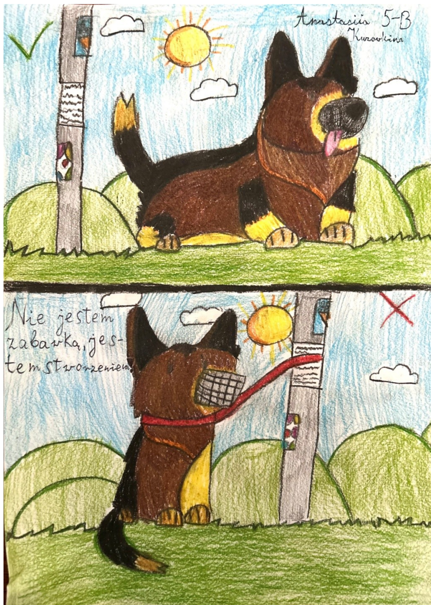
II miejsce Anastasia Kuzovkina Szkoła Podstawowa nr 60 im. Powstania Listopadowego w Warszawie