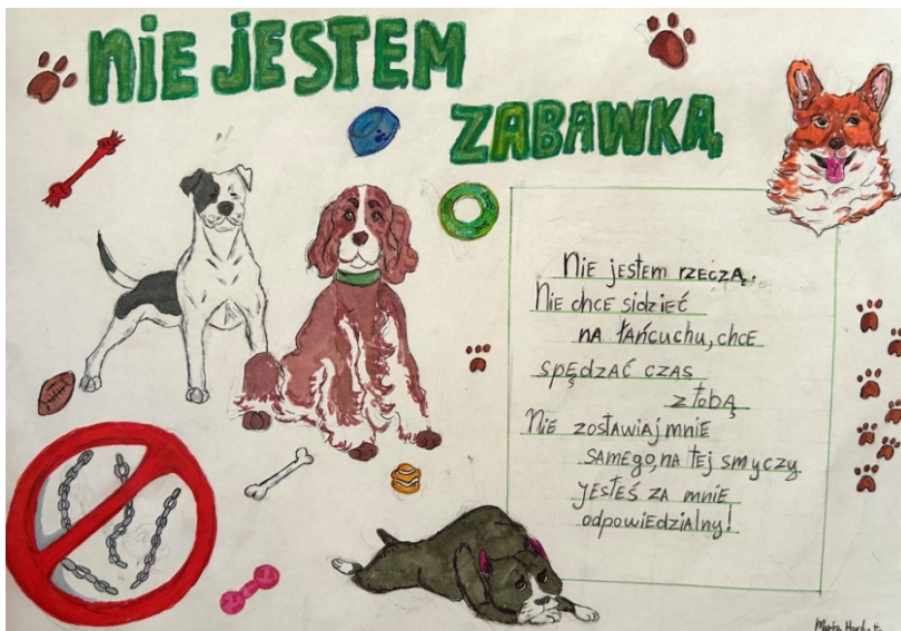
Maria Horbata Szkoła Podstawowa nr 60 im. Powstania Listopadowego w Warszawie