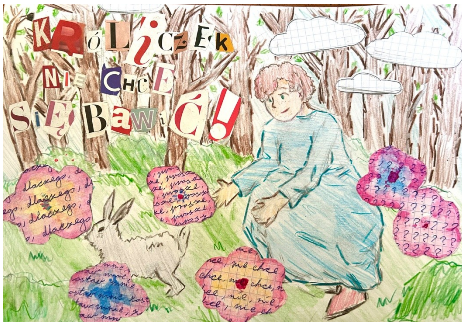
II miejsce Diana Fiedosewicz Szkoła Podstawowa nr 310 im. Michała Byliny w Warszawie