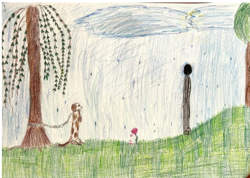
Aniela Owczarek - Szkoła Podstawowa nr 356 im. Ryszarda Kaczorowskiego w Warszawie