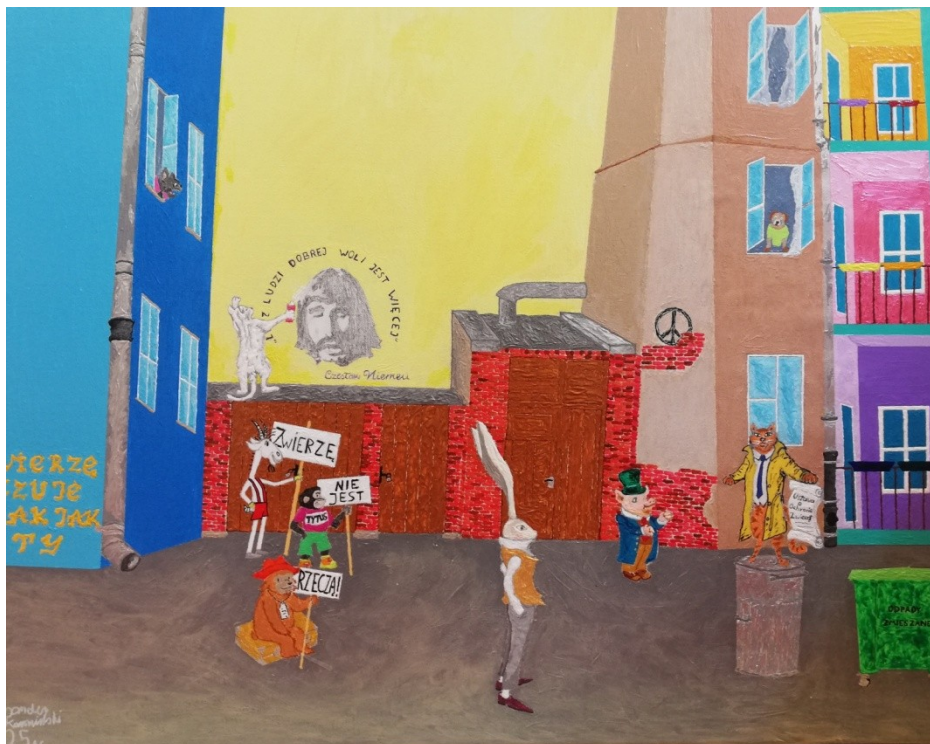
I miejsce Aleksander Karasiński Szkoła Podstawowa nr 168 im. Czesława Niemena w Warszawie