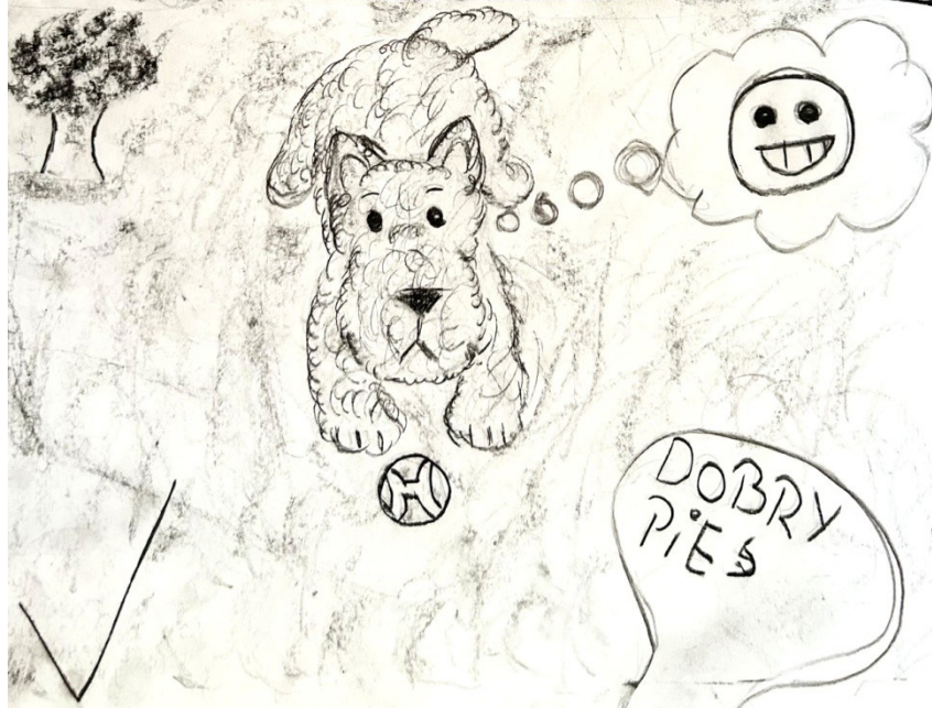
Grzegorz Gruszka – Szkoła Podstawowa nr 310 im. Michała Byliny w Warszawie